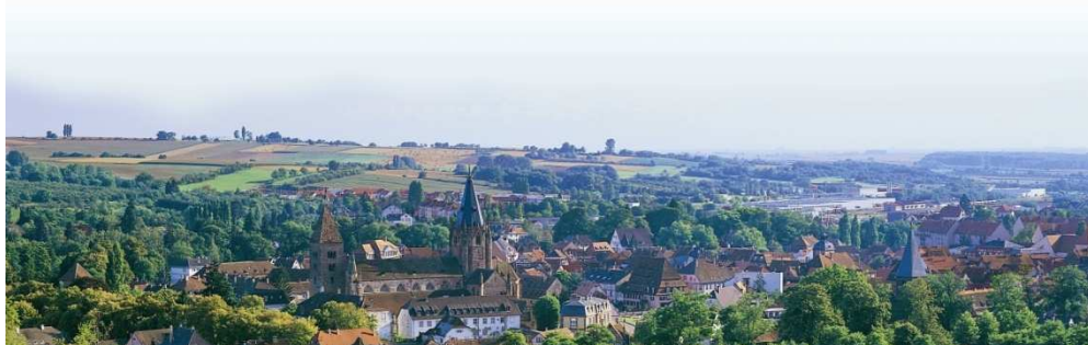
Petites propositions de randonnées :